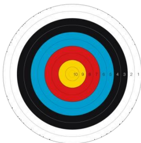
Target Face 122 cm Ring 10